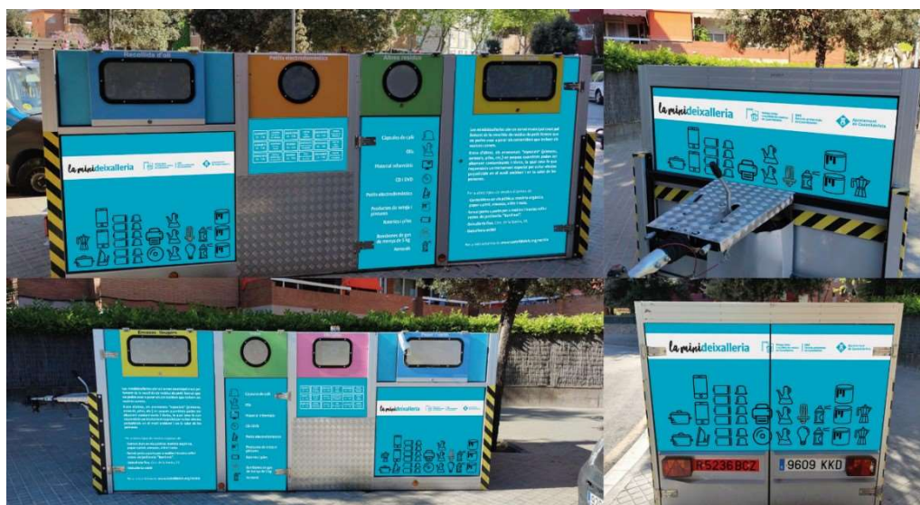
Figura 3. Nuevos minipuntos limpios habilitados en formato remolque.

Recientemente, dado el éxito de participación por parte de la ciudadanía de los antiguos quioscos reconvertidos en minipuntos limpios y con objeto de dar cobertura a la máxima población posible, en octubre de 2020 se añadieron dos nuevos minipuntos limpios, no obstante, el formato es distinto a los implementado al inicio de la actuación. En este caso, consta de un remolque transformado para ofrecer el servicio de minipunto limpio que cuenta con la misma línea de diseño e información que el resto de minipuntos limpios.