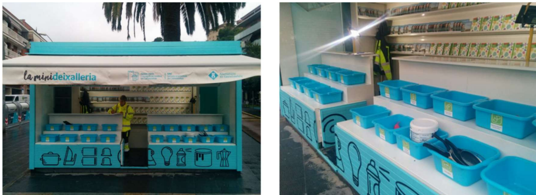
Figura 1. Pequeño punto limpio al antiguo quiosco de prensa de la Plaza Cataluña (Calle Església, 33) de Castelldefels.

Castelldefels es un municipio de la provincia de Barcelona, con una población de 67.460 habitantes (INE, 2020). Con el objetivo de evitar que en los contenedores de la vía pública aparezcan residuos que necesitan un tratamiento especial (pilas, aceite usado, pequeños electrodomésticos, etc.) y para concienciar y facilitar a la ciudadanía la importancia de la separación de estos residuos especiales de pequeño formato, el consistorio, a través de los Servicios Ambientales de Castelldefels (SAC), empresa municipal que se encarga del servicio de recogida de residuos urbanos, puso en marcha en octubre de 2018 un proyecto de transformación de seis antiguos quioscos en minipuntos limpios.