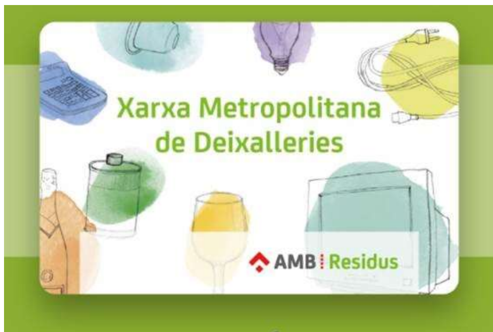
Figura 4. Ejemplo de la tarjeta de usuario de los puntos limpios de Castelldefels.

En cualquiera de los puntos limpios de Castelldefels (minipuntos limpios, punto limpio municipal y puntos limpios móviles), puede utilizarse la tarjeta de usuario del servicio de puntos limpios. Esta tarjeta permite la obtención de bonificación de la Tasa Metropolitana de Tratamiento de Residuos (TMTR), hasta un máximo del 14%, según el número de visitas anuales. Puede obtenerse a través de la web https://deixalleries.amb.cat/ .