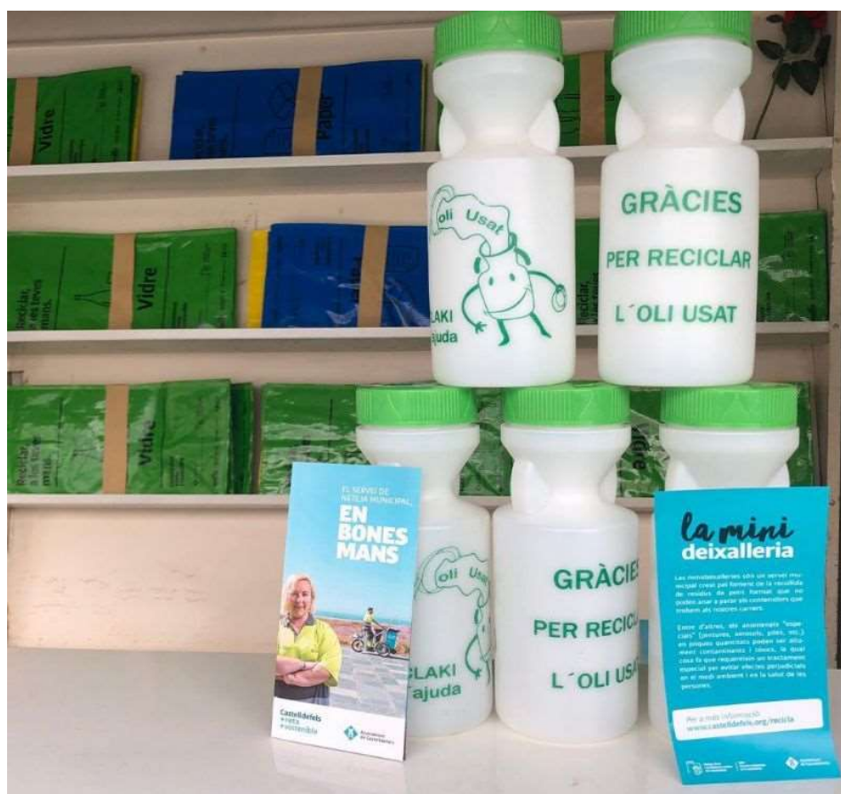
Figura 2. Recipientes destinados a almacenar el aceite de cocina vegetal doméstico distribuido desde los minipuntos limpios.

Por otra parte, desde el mes de marzo de 2019, tanto los minipuntos limpios como el punto limpio, disponen de un nuevo sistema para depositar su aceite usado. Los ciudadanos deben almacenar el aceite de cocina usado en un recipiente facilitado por el propio ente y, al entregarlo en el minipunto limpio, reciben a cambio otro recipiente limpio donde poder continuar depositando dicho residuo. En este sentido, se entrega un recipiente por unidad familiar u hogar.