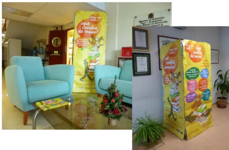
Figura 1. Díptico informativo y jaulas habilitadas para el depósito de enseres y ropa con el lema de la campaña Mejor que tirarlo... ¡que cambie de mano!

En este sentido, con la ropa recogida a través de los puntos establecidos de recogida se someten a un proceso de selección y evaluación de su estado y, en caso de que sea necesario, se someten a procesos de preparación previa a su reutilización (coser pequeños desperfectos, higienizar y planchar).