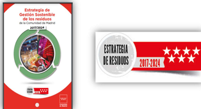
Figura 1. Estrategia de Gestión Sostenible de los Residuos de la Comunidad de Madrid 2017-2024. Fuente: Comunidad de Madrid, 2022.

En noviembre del 2018, el consejo de Gobierno de la Comunidad de Madrid (6.751.251 habitantes 1 ) aprobó su Estrategia de Gestión Sostenible de los Residuos para el periodo 2017-2024. La estrategia define un modelo de gestión de residuos que da respuesta a las necesidades de la comunidad de Madrid, estableciendo las medidas necesarias para cumplir con los objetivos fijados en este ámbito por la normativa europea y española y por el Plan Estatal Marco de gestión de Residuos (PEMAR) 2016-2022. Conforme a este criterio general, la estrategia está conformada por 10 planes de gestión y un programa de prevención de residuos.