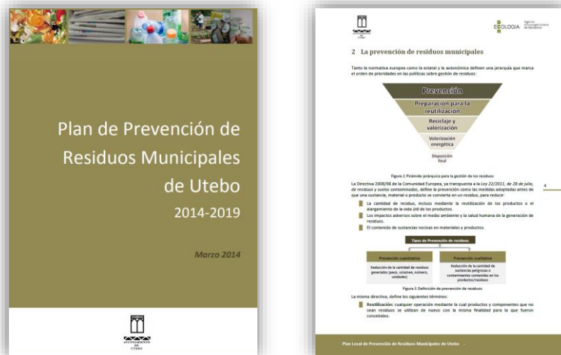
Figura 1. Plan de Prevención de Residuos Municipales de Utebo 2014-2019. Fuente: Ayuntamiento de Utebo.

En marzo de 2014, el Ayuntamiento de Utebo (18.593 habitantes 1 ) aprobó su Plan de Prevención de Residuos Municipales 2014-2019, una herramienta de planificación estratégica para conseguir los objetivos de prevención establecidos por la normativa y la planificación aplicable. La misión del Plan se concreta en tres puntos: fomentar la reducción de la generación de residuos del municipio; disminuir la cantidad de sustancias peligrosas contenidas en los materiales y productos y los impactos negativos sobre la salud de las personas o el medio ambiente de los residuos generados; y, movilizar a todos los actores implicados en promover el cambio de hábitos orientado a la prevención de residuos: ciudadanía, empresas, comercios, asociaciones y administraciones.