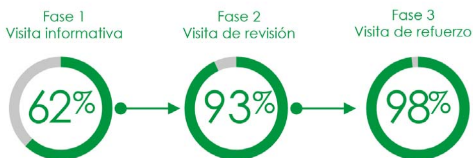
Figura 4. Evolución del porcentaje de establecimientos recicladores en Madrid en el marco de la campaña llevada a cabo en el sector Horeca.

Finalmente, en la fase 3, se encuestaron un total de 797 establecimientos de los cuales 637 eran recicladores, lo que supone un 80% del total de la muestra. Tras estas fases el porcentaje total de establecimientos recicladores identificados en Madrid incrementó hasta el 98%.