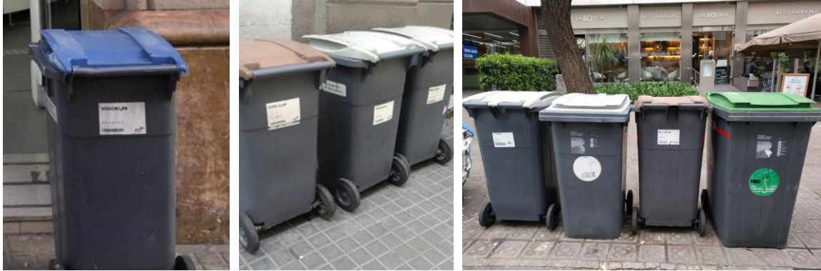
Figura 2. Cubos de recogida selectiva comercial en Barcelona.

Desde el año 2011 se lleva a cabo, por parte del Ayuntamiento de Barcelona, un programa de seguimiento de la calidad de la fracción orgánica recogida a través del servicio de recogida selectiva comercial, mediante el análisis del porcentaje de impropios presentes en este servicio. Este programa es muy completo tanto por el número de agentes implicados, como por el intercambio y gestión de la información analizada.