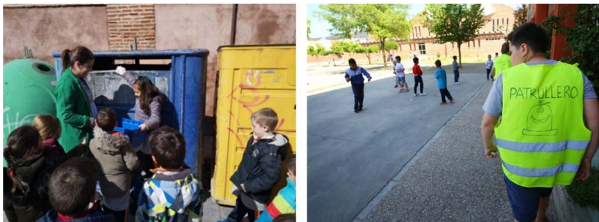
Figura 1. Patrulla de Reciclaje del colegio Sant Juan de la Cruz (izquierda) y Patrulla Verde en el patio de recreo del colegio Virgen de la V Angustia de Cacabelos (derecha) Recicla. Fuente: https://www.colegiosanjuandelacruz.com/ y ICAL Patrulleros de limpieza en el colegio la V Angustia, 2019.

Una vez finalizada la formación, las actividades de sensibilización y concienciación se pueden desarrollar recorriendo espacios públicos (a pie de calle, en centros comerciales, instalaciones deportivas, mercados locales, etc.) con el objetivo de involucrar tanto a los alumnos como a vecinos y habitantes del municipio en el fomento y aplicación de unas buenas prácticas en los hogares y comercios. Asimismo, complementando las acciones de concienciación en la vía pública, también se pueden implementar patrullas dentro de los centros escolares, con alumnado responsable de detectar e informar de problemáticas, malas prácticas o desperfectos dentro de las instalaciones escolares.