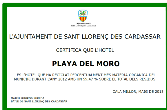
Figura 1. Ejemplo de certificado entregado por el Ayuntamiento de Sant Llorenç des Cardassar, con el objetivo de reconocer la labor realizada por los establecimientos turísticos en materia de reciclaje.

Anualmente, el ayuntamiento organiza una jornada de medio ambiente en la que se dan a conocer los resultados de recogida selectiva, aprovechando la misma para reconocer a los establecimientos turísticos que han reciclado más, mediante la entrega de un certificado.