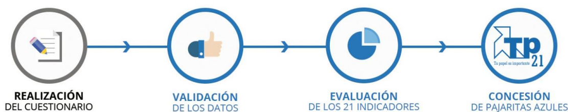
Figura 1. Programa Pajaritas Azules.

La evaluación se basa en 21 indicadores que analizan todo lo referente a la recogida del contenedor azul y recogidas complementarias, las campañas y acciones de información y concienciación ciudadana, los aspectos relativos a la regulación y la planificación de la gestión y los resultados y trazabilidad hasta reciclaje final. Cada uno de los indicadores se valora según los baremos establecidos y la puntuación máxima que puede alcanzarse es de 100 puntos. ASPAPEL ha diseñado el programa de manera que ofrezca un incentivo de mejora a través de la entrega de Pajaritas Azules a aquellos municipios o agrupaciones de municipios, que cada año destacan entre los participantes en el programa por alcanzar altos niveles de excelencia en la gestión de la recogida selectiva de papel-cartón. Este grupo de entidades locales que se han distinguido por su gestión obtienen un especial reconocimiento, consistente en una, dos o tres Pajaritas Azules, en función de un baremo objetivo y a partir de los resultados obtenidos en la evaluación. En función