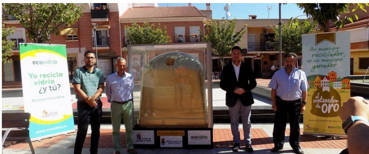
Figura 2. Campaña El Contenedor de Oro : instalación del Contenedor de Oro en el municipio de la Laguna de Duero como ganador de la iniciativa durante el mes de junio de 2016 en Castilla y León.

Con esta iniciativa se pretende sensibilizar a la población habitante de los municipios en lo relativo al reciclaje de vidrio. Cada mes, Ecovidrio hace público el número de kilos reciclados por cada uno de los municipios participantes, en función a las mediciones realizadas en las plantas de tratamiento receptoras de los residuos de envases de vidrio. Los resultados se publican en una página web creada al efecto de la iniciativa. En este sentido, existe un ganador mensual, que tiene el honor de situar El Contenedor de Oro en una ubicación céntrica de su municipio durante un mes. Adicionalmente, en el municipio que más aumenta su volumen de reciclaje durante el periodo promocional con respecto al mismo periodo del año anterior se instala un parque de Mr. Iglú , o bien obtiene una cantidad económica que puede destinar a proyectos medioambientales.