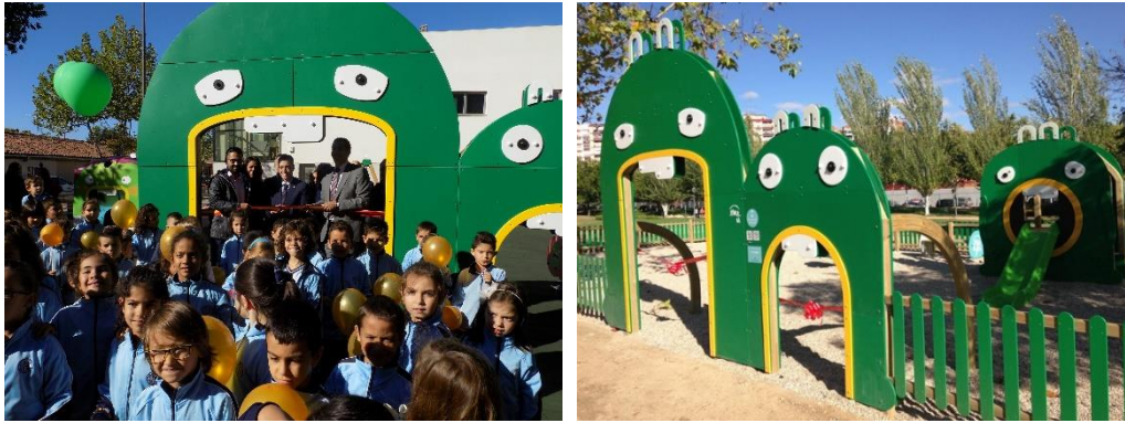
Figura 3. Inauguración del parque de Mr. Iglú en Benavente, municipio ganador de la campaña El Contenedor de Oro en Castilla y León.