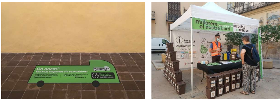
Figura 3. Adhesivo de informativo sobre la nueva ubicación (izquierda), y set informativo sobre el nuevo sistema (derecha).