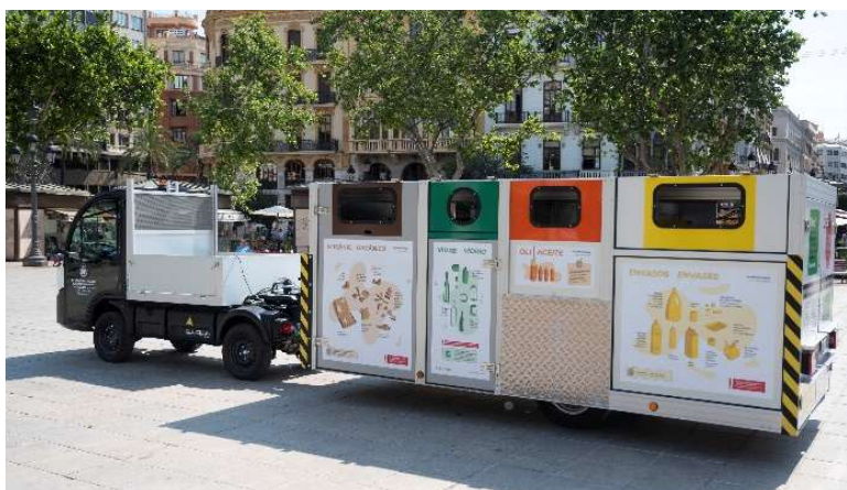
Figura 3. Presentación de la plataforma de recogida móvil con todas fracciones que incluye.

El uso de las plataformas móviles está destinado exclusivamente a uso doméstico. No obstante, tal como se ha apuntado previamente, en el marco de la implementación del nuevo servicio, el Ayuntamiento puso en marcha un servicio de recogida puerta a puerta de los residuos de la fracción resto, vidrio y papel-cartón, para los establecimientos comerciales y restauración de la zona.