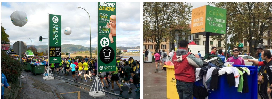
Figura 2. Cursa Behobia-San Sebastián: contenedores para la recogida de ropa.

Adicionalmente, desde el año 2009, debido al cambio en el sistema de avituallamientos 3 , se ha conseguido reducir el volumen de residuos generados y dar un buen final a los vasos utilizados, enviándolos a la planta de compostaje para su tratamiento. También se empezó a recoger la ropa desechada por los corredores en la salida, la cual se destina al proyecto Oldberr 4 de Cáritas. Así, se colocan contenedores específicos próximos al arco de salida y, con el fin de que sean bien visibles entre los miles de participantes, están señalizados con paneles de color verde y unos globos de helio que permiten ubicarlos a distancia.