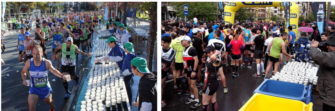
Figura 1. Cursa Behobia-San Sebastián: avituallamiento instalado en un punto del recorrido (izquierda); y, contenedores para la recogida selectiva de los residuos generados en la meta (derecha).

La Behobia-San Sebastián es una carrera popular que anualmente aglutina más de 30.000 corredores. En este contexto, desde el año 2002, la entidad organizadora, en estrecha colaboración con la Mancomunidad de San Marcos 1 , la Mancomunidad de Servicios de Txingudi 2 y la empresa Fomento de Construcciones y Contratas (FCC), impulsa la separación en origen para su recogida selectiva y posterior reciclaje de los residuos generados en la meta y en los avituallamientos del recorrido. En meta, es necesaria la colaboración de los participantes para que depositen los envases utilizados en los contenedores habilitados para tal finalidad.