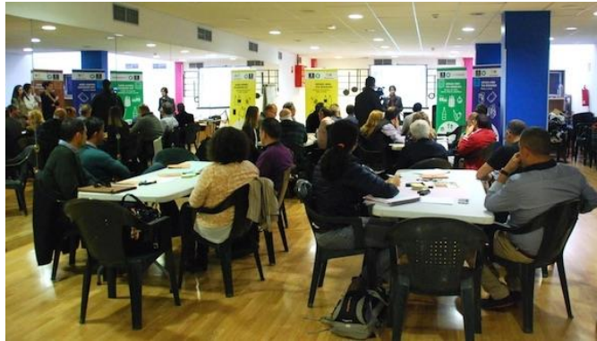
Figura 2. Jornadas de trabajo con la participación de profesionales del sector turístico en Mogán.

Adicionalmente, aquellas empresas turísticas que mejoraron de forma significativa la gestión de sus residuos fueron galardonadas por el Cabildo de Gran Canaria con el reconocimiento Gran Canaria Recicla . En este sentido, cuatro establecimientos fueron distinguidos: hoteles Club Gran Anfi y Sunwing Arguineguín de Mogán, el hotel Lopesan Costa Meloneras y los apartamentos Cay Beach Meloneras .