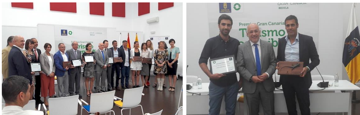
Figura 3. Entrega de los premios a los mejores establecimientos turísticos.

Adicionalmente, aquellas empresas turísticas que mejoraron de forma significativa la gestión de sus residuos fueron galardonadas por el Cabildo de Gran Canaria con el reconocimiento Gran Canaria Recicla . En este sentido, cuatro establecimientos fueron distinguidos: hoteles Club Gran Anfi y Sunwing Arguineguín de Mogán, el hotel Lopesan Costa Meloneras y los apartamentos Cay Beach Meloneras .