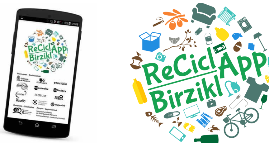
Figura 1. Aplicación ReciclApp-BirziklApp promovida por el Gobierno de Navarra.

El Gobierno de Navarra, en el marco de los convenios que mantiene con los Sistemas Integrados de Gestión de Residuos 1 y con la colaboración de las mancomunidades de gestión de residuos de Navarra, ha desarrollado la aplicación ReciclApp-BirziklApp , una herramienta para dispositivos móviles con la que se pueden resolver dudas y conocer más sobre el reciclaje de los residuos en Navarra. Con ella se puede conocer en qué contenedor se deposita cada residuo, dónde están localizados los puntos limpios y algunos contenedores específicos (ropa, aceite, pilas, etc.), las zonas de compostaje comunitario y la información sobre la recogida de voluminosos. Además, se puede conocer más sobre el destino de los residuos en Navarra, a través de audiovisuales e información de las mancomunidades.