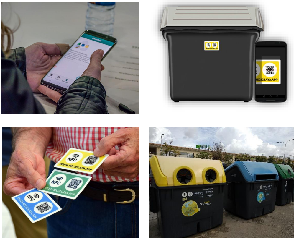
Figura 2. Proyecto TagItSmart: usuario de Carrefour utilizando la aplicación Recicla Ya (superior izquierda); contenedor con una etiqueta QR (superior derecha); adhesivos QR/NFC asociados al proyecto (inferior izquierda); y, contenedores en Palma (inferior derecha).

Finalmente, los ciudadanos tienen que depositar los residuos en el contenedor correspondiente y comparar el producto desechado con un código QR que se ha colocado en los contenedores de envases, papel-cartón y vidrio de las dos ciudades. De esta forma, si los clientes reciclan correctamente, obtienen puntos canjeables en forma de descuentos en productos ecológicos o en campañas de sensibilización relacionadas con la prevención de residuos y el reciclaje que revierten en el municipio.