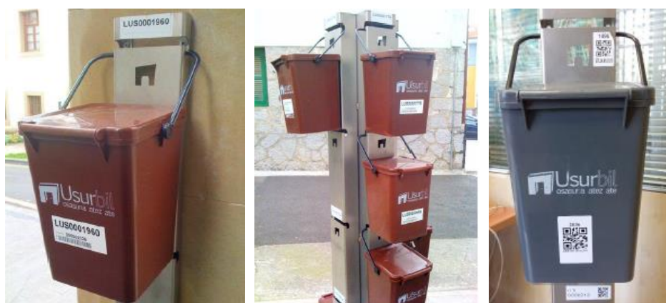
Figura 1. Cubos para la recogida de residuos en Usurbil.

Posteriormente, en 2014 se implantó un sistema de pago por generación, circunstancia que provocó la introducción de cambios en el sistema de recogida de residuos puerta a puerta. Concretamente, se modificó el modo de depositar la fracción resto que, en vez de sacarse con una bolsa, se saca a través de un cubo gris de 10 litros que el Ayuntamiento de Usurbil repartió en cada barrio de forma gratuita. Cada cubo dispone de una etiqueta identificativa de la vivienda (código QR y código de barras), posibilitando así, que se desarrolle un sistema de pago por generación para calcular el importe de la tasa de residuos.