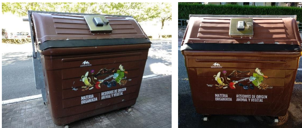
Figura 1. Contenedores con cerradura de apertura mediante tarjeta electrónica en la Mancomunidad de Servicios de Txingudi: Hondarribia (izquierda) y Irun (derecha).

Quien estando de alta en el sistema todo el año no cumpla con las condiciones de uso efectivo recogidas en el párrafo anterior, se le liquidará, en concepto de corrección de tasa, el importe equivalente a una doceava parte de la diferencia existente entre la tarifa sin bonificación y la tarifa con bonificación por cada mes que no se le hayan contabilizado al menos tres depósitos mensuales en días naturales distintos.