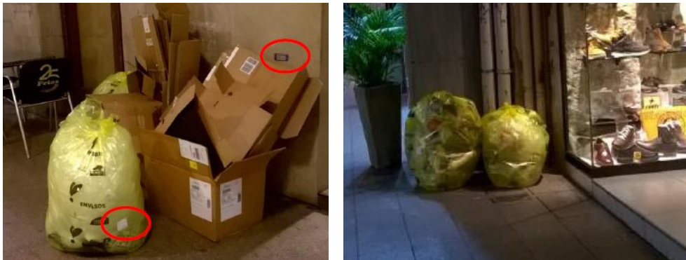
Figura 1. Bolsas con TAG UFH utilizadas en la recogida comercial de Lleida.

Una de las particularidades del nuevo servicio de recogida puerta a puerta comercial es el uso de bolsas personalizadas que incorporan un TAG UFH para las fracciones envases ligeros (bolsas de 60L para el comercio pequeño y de 120L para los grandes productores) y resto (bolsas de 35L para el comercio pequeño y de 60L para los grandes productores). Estas bolsas permiten identificar a los usuarios que participan en la recogida selectiva, asociarles incidencias y controlar la frecuencia de recogida de los residuos.