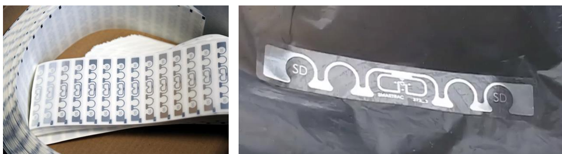
Figura 1. Etiquetas con un TAG RFID utilizadas en la prueba piloto desarrollada en la Mancomunidad de Servicios de Txingudi.

En esta experiencia participaron un total de 798 familias (646 de Irun y 152 de Hondarribia), que se presentaron voluntariamente, y a quienes se les entregó un folleto explicativo y un total de 60 TAGs adhesivos.