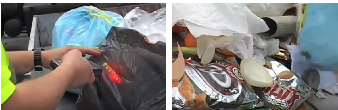
Figura 3. Inspección aleatoria de las bolsas con TAG RFID utilizadas en la prueba piloto desarrollada en la Mancomunidad de Servicios de Txingudi.

Además, de forma aleatoria, se analizaron algunas bolsas identificadas para conocer el nivel de separación que se estaba haciendo de las distintas fracciones de residuos y, así, obtener información de interés para impulsar nuevas acciones de mejora.